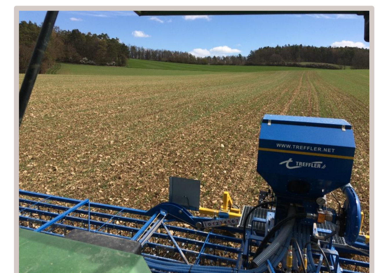
Untersaat in Sommergerste