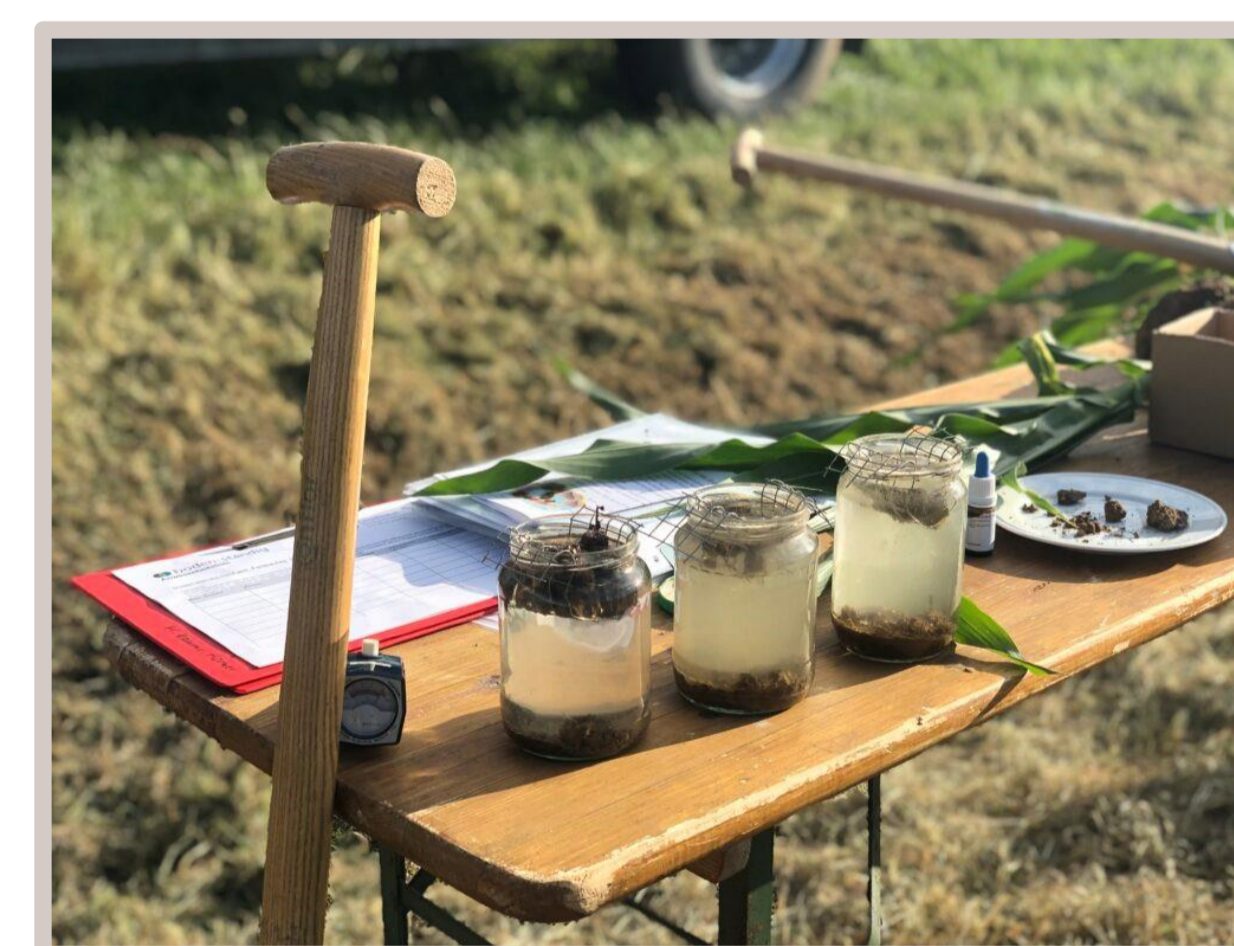
Erweiterte Bodenansprache und Aggregatstabilitätstest