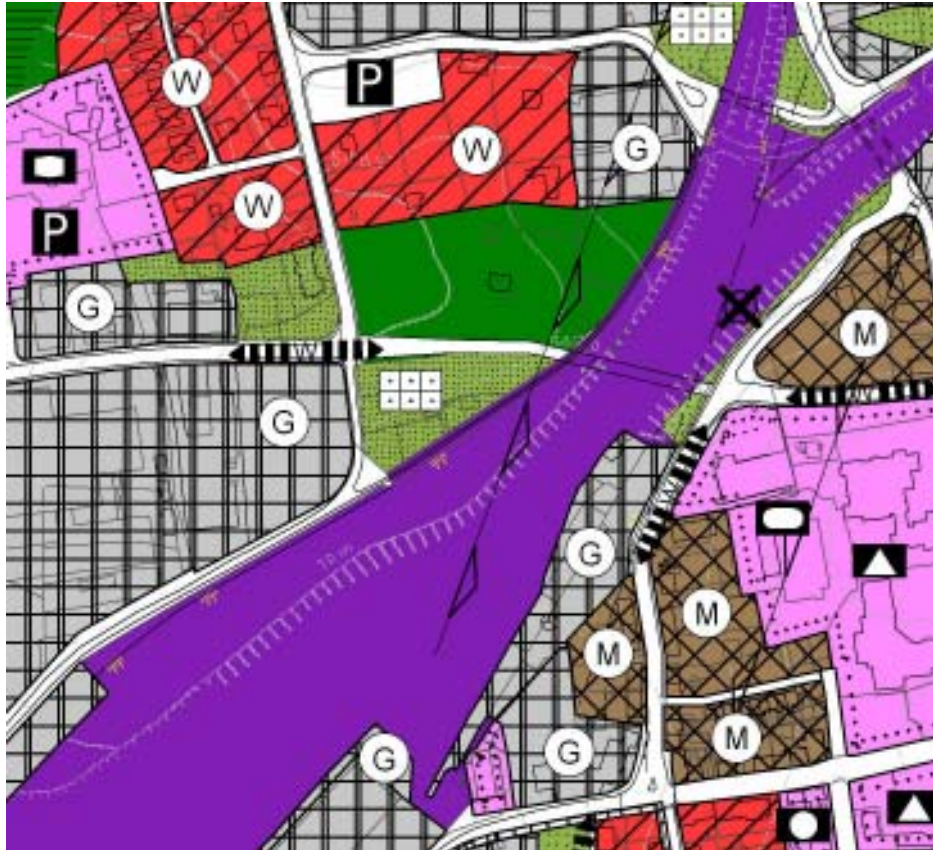
Auszug aus dem Flächennutzungsplan im Bereich der Verbindung zwischen Thölauer Straße und Fritz-Thomas-Straße (M 1:5.000)