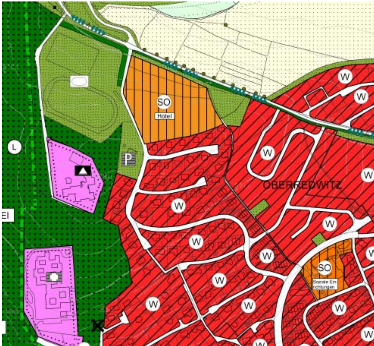
Auszug aus dem Flächennutzungsplan im nordwestlichen Siedlungsbereich von Oberredwitz (M 1:5.000)

Im Osten von Marktredwitz wird der Bereich großflächiger Einzelhandelskonzentration südlich der Wölsauer Straße als Sondergebiet dargestellt. Des Weiteren werden im Westen der Marktredwitzer Innenstadt an der Waldershofer Straße sowie am Knoten von B 303 und B 15 südwestlich Lorenzreuth entsprechend der vorhandenen Nutzung Sondergebiete für den großflächigen Einzelhandel dargestellt.