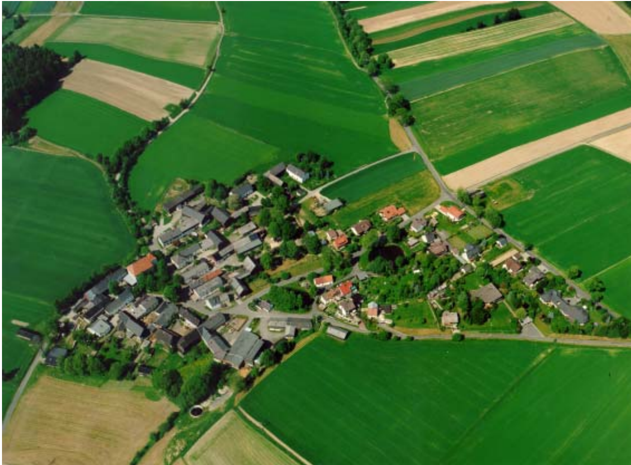
Stadtteil Pfaffenreuth, Blickrichtung Norden